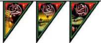
ریشه چهارده معصوم