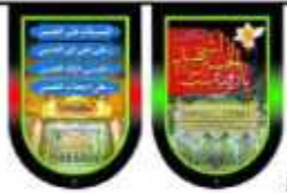
۲ برگ درهر ریشه به طول تقریبی ۸ متر