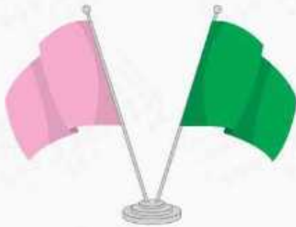
پرچم رومیزی ساتن