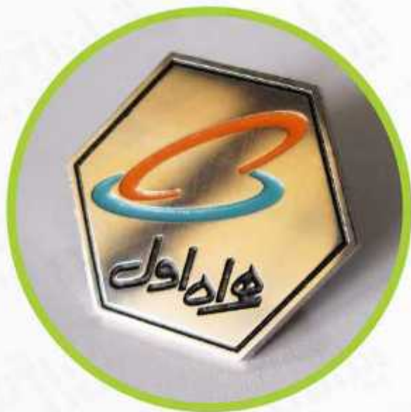
بج های رنگی