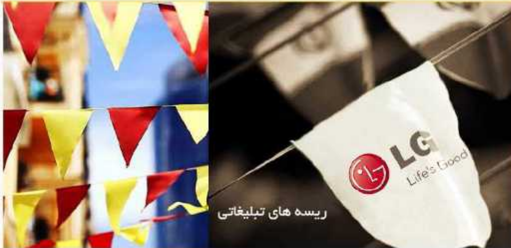
ریسه های تبلیغاتی