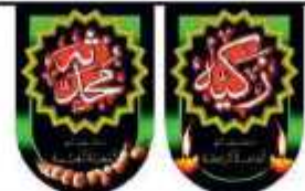
ریشه لیگزد اسما، حضرت فاطمه