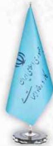
پرچم روميڙي مخروطي (جديد)