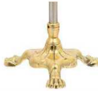
پایه پنجه شیری طلایی نوع دو