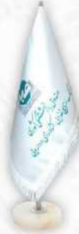
ساتن آمريکايي چاپ سيلک