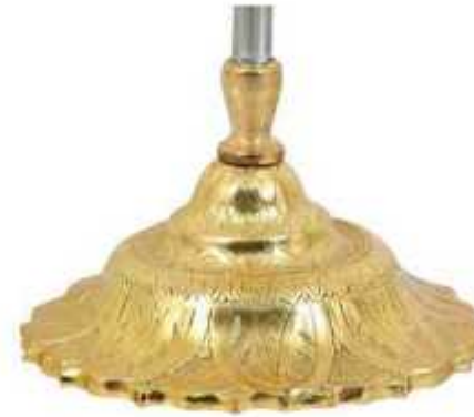
پایه خورشیدی کله قندی