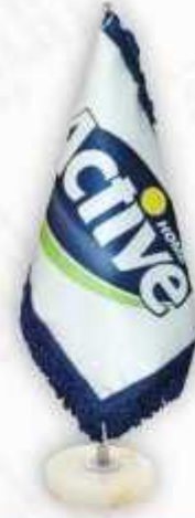
ساتن چاپ ديڄيٽال