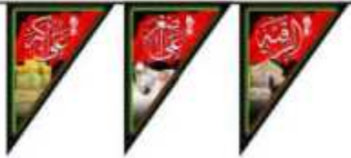
ریشه لیگزد طرح محرم