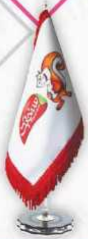
ساتن آمريکايي چاپ ديڄيٽال