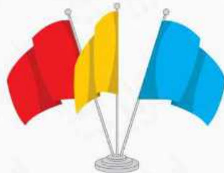
پرچم رومیزی ساتن