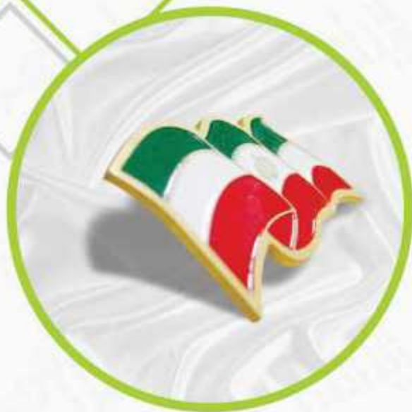
بج با پوشش اپوکسی