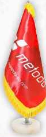
ساتن براق چاپ سيلک