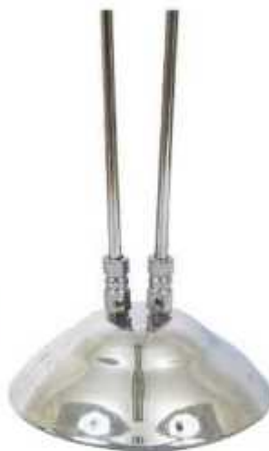
پایه استیل دوميله