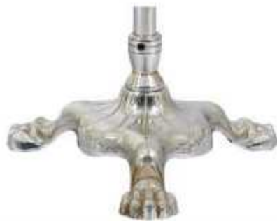
پایه پنجه شیری نقره‌ای