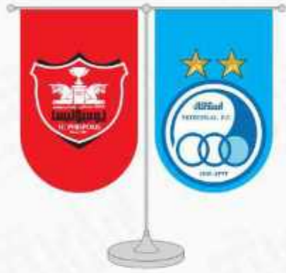
پرچم رومیزی ساتن