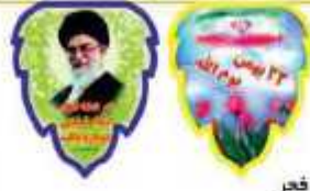
ریشه برگي دهه فجر