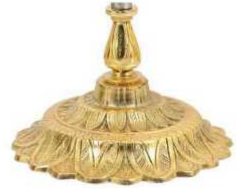
پایه خورشیدی ممتاز