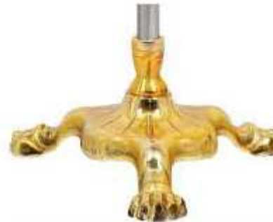
پایه پنجه شیری طلایی نوع یک