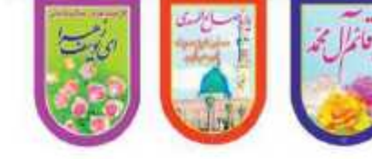
ریشه نیمه شعبان