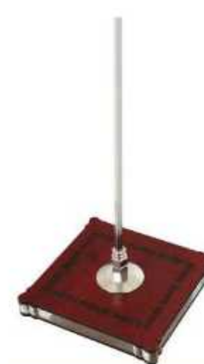
پایه چوبی رومیزی