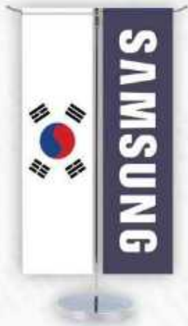
پرچم روميڙي تي