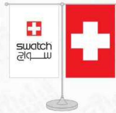
پرچم رومیزی ساتن