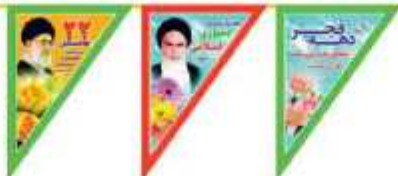
ریشه دهه فجر