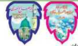
ریشه برگي نیمه شعبان