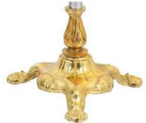
پایه پنجه شیری ممتاز