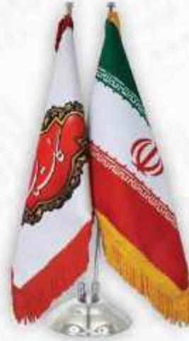
پرچم روميڙي دوميله