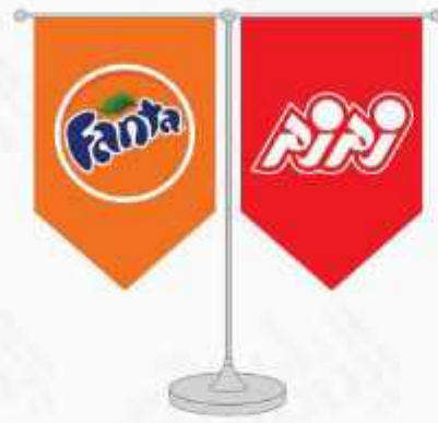
پرچم رومیزی ساتن