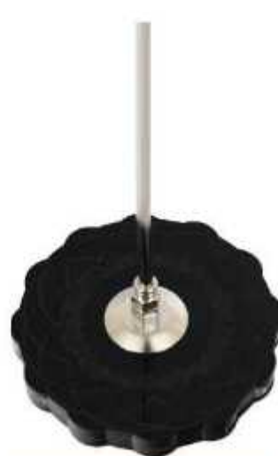
پایه پلکسی مشکی