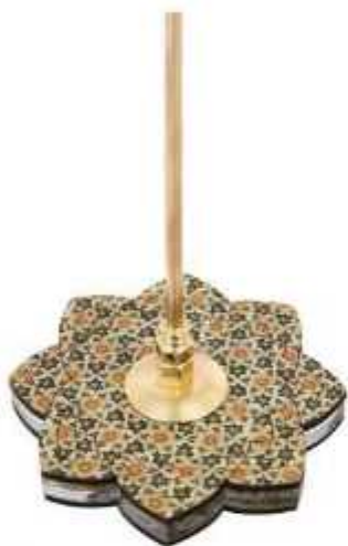
پایه خاتم گل