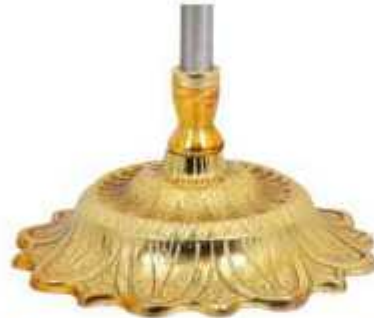
پایه خورشیدی طلایی نوع یک