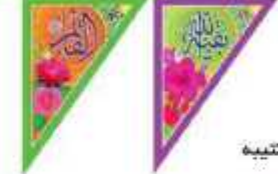
ریشه مثلث طرح کتیبه