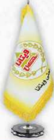
چير چاپ سيلک