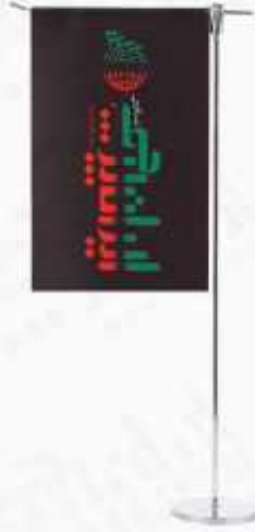
پرچم روميڙي ال