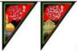
۲ برگ درهر ریشه به طول تقریبی ۸ متر