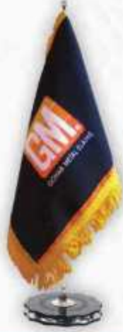
چير چاپ سيلک