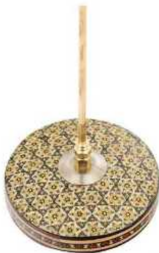
پایه خاتم گرد