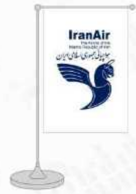
پرچم رومیزی ساتن