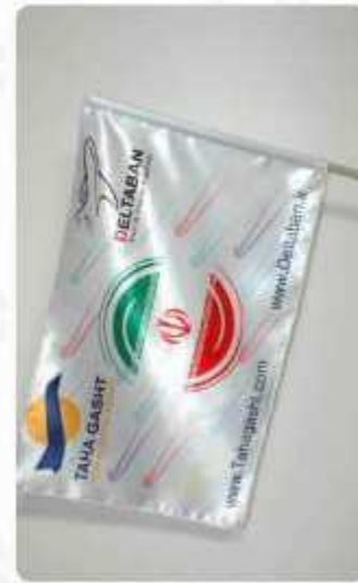
پرچم دستی تبلیغاتی