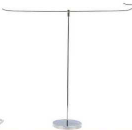
پایه استیل تی