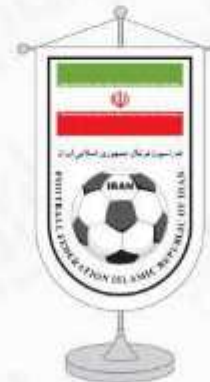
پرچم رومیزی ساتن