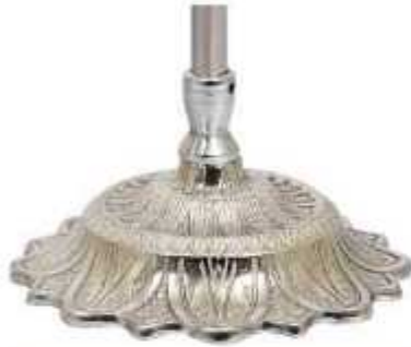
پایه خورشیدی نقره‌ای