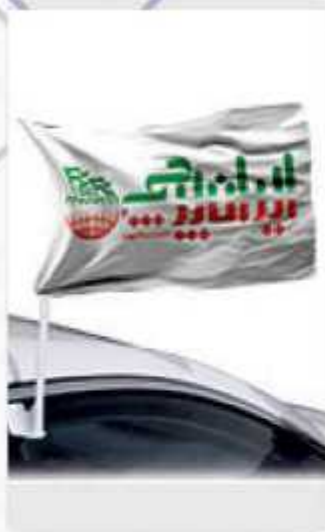
پایه پرچم ماشینی